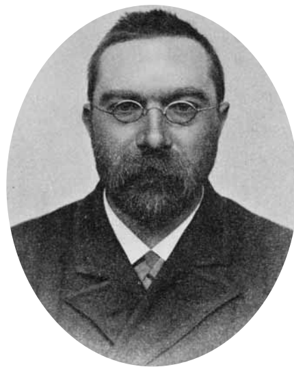
Per Sivle var ein fornyar i mange samanhengar i diktinga si; sosialt, politisk, historisk – og han var ein fin humorist.