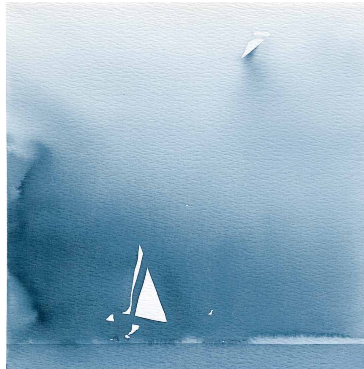
«Vi skal ikkje sova bort sumarnatta.....»