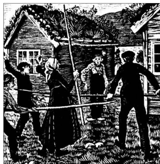
Illustrasjon til novellen «Han som var saa fæl til at fri» av Hans E. Kinck. Tresnitt av Nikolai Astrup, 1917.

Men Welhaven har også eit skarpt kritisk blikk på landskapet og folket, i sine Billeder fra Bergens-kysten , tildels farga av forfatteren sin forfina og urbane kulturhorisont. Skildringa hans av strilelandet er prega av sarkasme meir enn av kunnskap (©283). Og då er vi, bokstaveleg tala, ute i dei regionale landskapa.