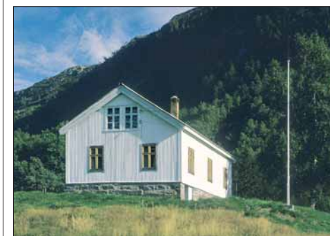
Heimen til Olav Nygard i Modalen.

Å kalla landskapet vakkert er av heller ny dato og først og fremst utvikla av romantikarane. Ein skjønnlitterær tekst som omhandlar heile amtet, ja heile Vestlandet, er nettopp eit romantisk dikt, «Bergens Stift» av J. S. WELHAVEN (1807–1873), frå samlinga Digte (1838). Den diktande eg sit i hovudstaden og manar fram eit minnestykke, i sterke romantiske, naturbilete og allegoriar; gripen av lengsel etter barndommens landskap i vest: