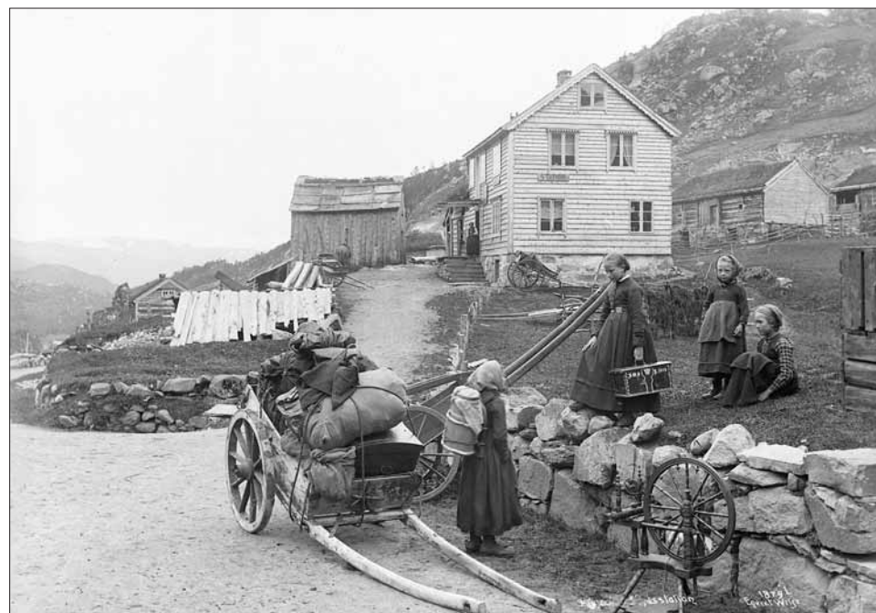
Skysstasjonen på Seljestad høyrer til generasjonen for turisthotella. Foto frå 1880-åra.

Dei fleste av desse fantastiske og største hotella i Noreg låg i Hordaland. Mellom desse var det først og fremst det andre HOTEL HARDANGER i Odda – som stod heilt fram til 1977 (@398) – det andre, tredje og fjerde STALHEIM HOTEL – som brann i 1959 (@354) – og FLEISCHERS HOTEL (@346) på Voss; eitt av dei få sveitserstilhotella i Noreg framleis i full drift, som merkte seg ut. Mange av hotella