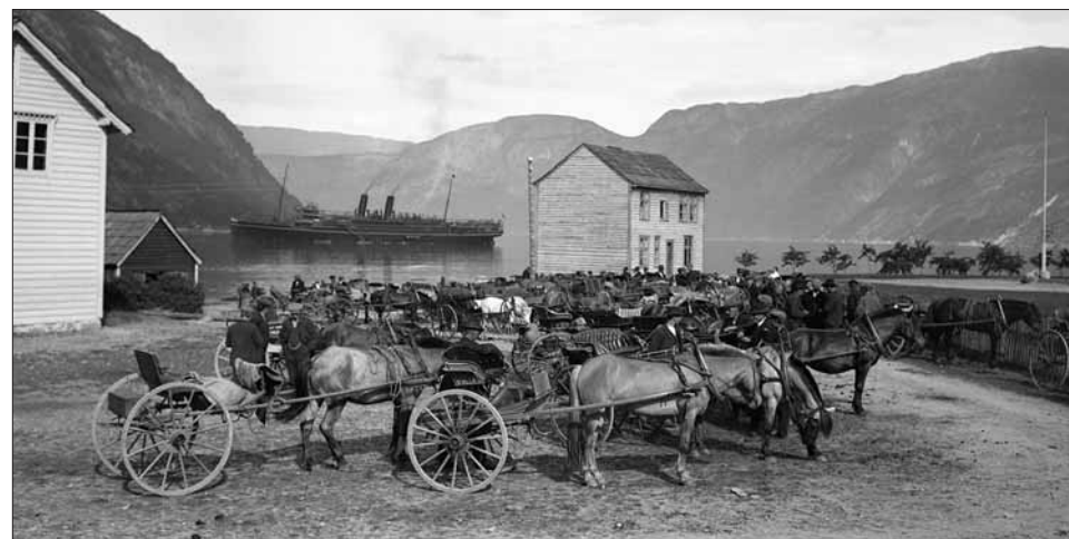
Når dei store turistskipa ankra opp i vika utanfor Eidfjord kring hundreårsskiftet, stod hesteskyssane oppstilte på rekkje og rad.