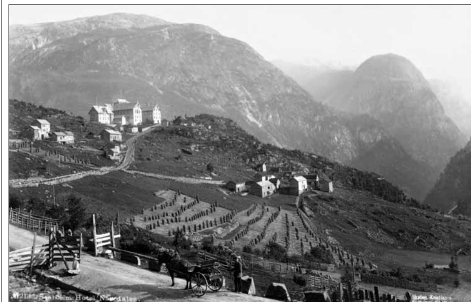
Det andre Stalheim Hotel med utsynet over Nærøydalen, var eitt av dei mest storslegne turisthotella i Noreg.