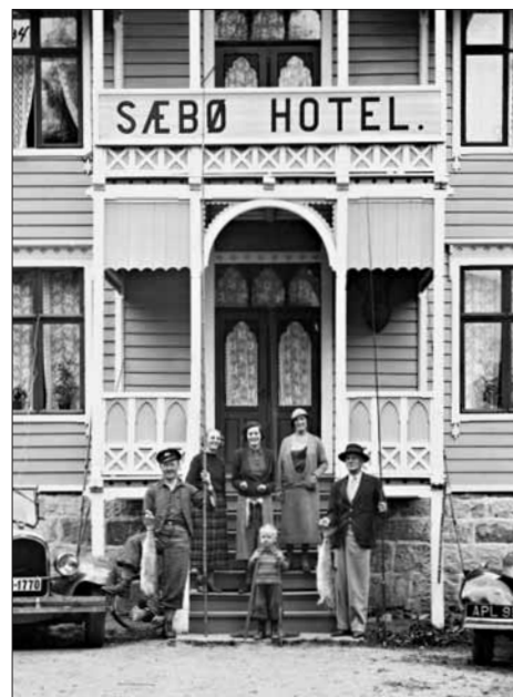
Laksefiske var ein stor attraksjon. Sæbø Hotel i Øvre Eidfjord.

Sjølv om stilen og forma i desse hotella var ny – tårn og karnapp, altanar og balkongar, forsynte med eit kniplingsverk