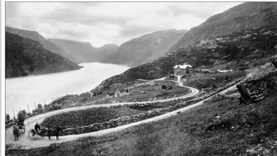
Vegen opp Hordalia, eller «Hårebakkane», med Breifond Hotel i bakgrunnen.